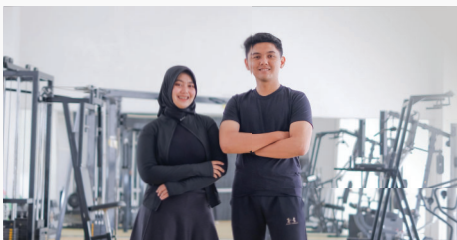
Adipadma Fitness Center